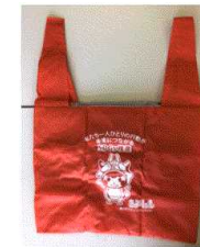
村から各家庭に配布されたエコバックもSDGsを推進しています