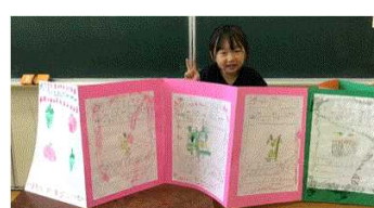
ミニトマトとれたよ！