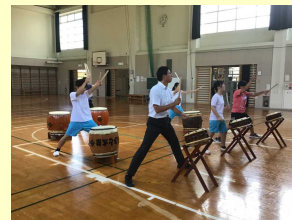
熱がこもってきた 伝統の和太鼓の練習

10月21日(土)、宮ヶ瀬ふれあい文化祭を開催します。中学生3名と少ない人数ではありますが、日頃の学習の成果を発表できるように、現在準備に動んでいます。