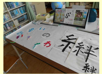
スローガン掲示制作中

さて、今年度のスローガンは「思いの輪 絆」に決めました。生徒たちは、年代関係なく、色々な発表を通して仲を深めたり、あふれる思いを共有したい気持ちをスローガンに込めました。小学校や地域の皆様と、思いの輪をつなぎ、絆が深まるよう、温かい雰囲気文化祭ができるようにしたいと思います。是非、会場まで足を運んでいただいで、温かい気持ちになっていただければ嬉しいです。